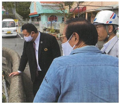
江永町河川改修視察