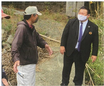
佐々町高峰川豪雨被害視察