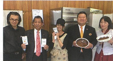
鹿町昆虫工場視察(中小企業支援)