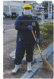
ここここグリーン佐々ボランティア