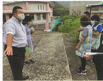
江迎町豪雨被害視察