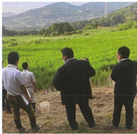
八の久保町災害復旧調査