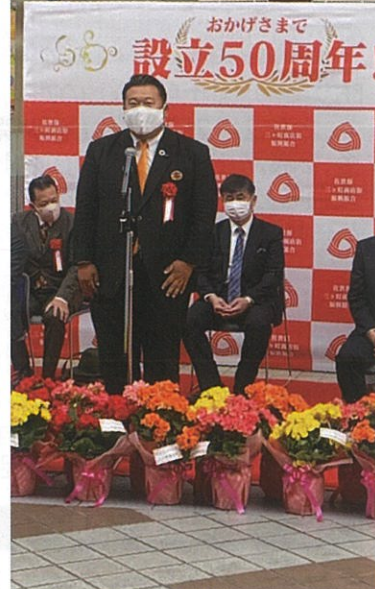
三ヶ町商店街50周年記念式典